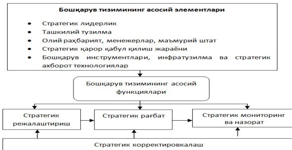
1-Расм. Стратегик бошқарув тизими асосий элементлари ва функциялари концепцияси 3

Мавзуга оид адабиётлар шарҳи. М.Шарифхўжаев [М.Шарифхўжаев, 2001] фикрига кўра стратегик бошқарув – бу корхона (фирманинг) истиқбол мақсади ва имкониятини ходимлар манфаати билан уйғунлаштиришни назарда тутувчи узок муддатли бошқарув усулидир. 2